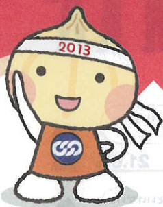
連合キャラクター ユニオニオン