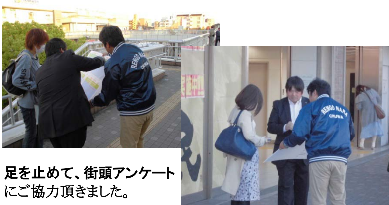
足を止めて、街頭アンケートにご協力頂きました。

小さな声も集まれば大きな声になる、と一人一人の声が大切だと訴えながら、アンケートに協力頂きました。