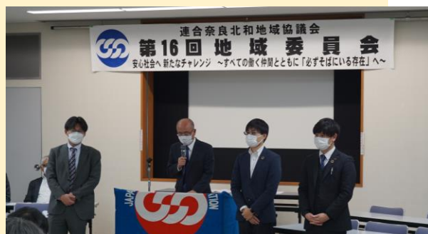
橋議長より新役員3名を紹介

第16回地域委員会をもって3名の役員・幹事の方が退任されました。これまでのご功績に感謝し、在任2年以上の方を功労者として表彰します。