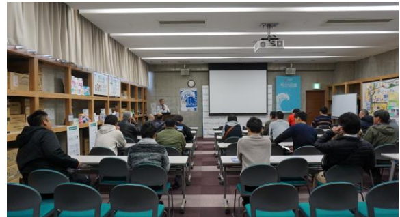
施設や防災についてお話をうかがいました