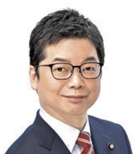
いしばし みちひろ 石橋 みちひろ 立憲民主党 現職(2期)