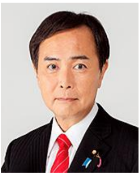
かわいたかのり 川合 孝典 国民民主党 現職(2期)