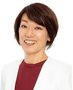
こが ちかげ 古賀 ちかげ 立憲民主党 新人