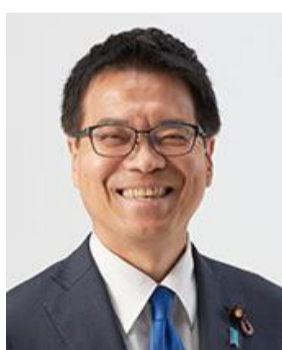
はまぐち まこと 浜口 誠 国民民主党 現職(1期)