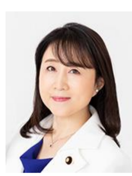
やた わかこ 矢田 わか子 国民民主党 現職(1期)