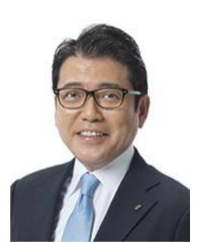
しば しんいち しば 慎一 立憲民主党 新人