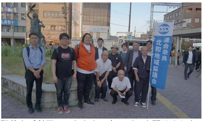
駅前をご利用のみなさまに右のビラを配りました