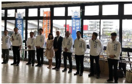
役員メンバー全員で訴えました

国民民主党の各級議員の皆さんにも協力を頂き、出勤する皆さんに「最低賃金」をご存知ですか? 「あなたの給料が最低賃金をクリアしていますか?」2018年10月4日から地域別最低賃金が811円に引き上げられました。もし、おかしいなど思われたら「なんでも労働相談ダイヤル」もしくは「連合奈良」にお問い合わせをしてください。と訴え、チラシの入ったティッシュを道行く人たちに配布致しました。